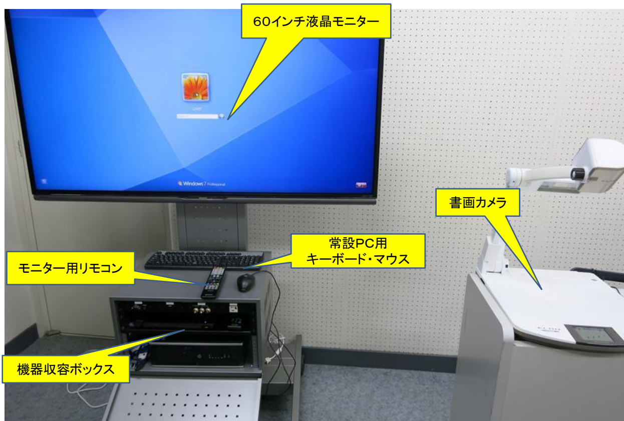
写真2: 機器收容ボックス