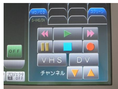
(タッチパネル画面)1